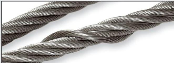
Lockerung der Außenlage

Vor der Überprüfung ist die Seilschlaufe Plus zu reinigen. Es sind folgende Kriterien zu beachten: