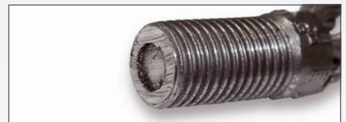
Seilauzug aus Gewindeteil