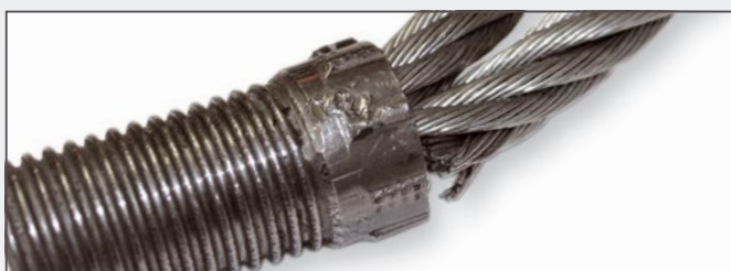
Bruch einer Litze