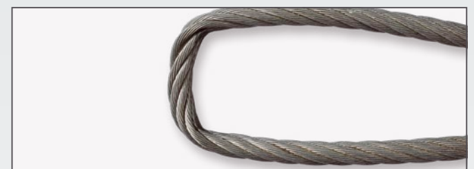
Quetschungen im Auflagebereich