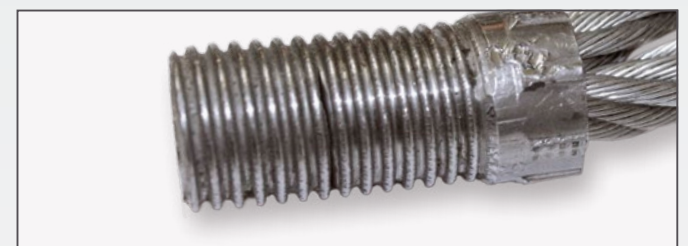
Bruch des Gewindeteils